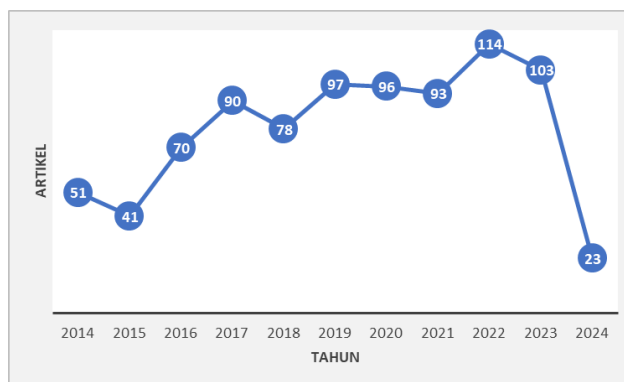
Gambar 1 Tahun publikasi dan jumlah artikel tentang anoa

Berdasarkan hasil penelusuran dengan kata kunci Anoa AND Conservation periode tahun 2014-2024 pada database publish of perish terdapat 856 artikel.